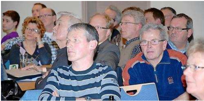
Das Interesse der Erfurtshäuser an einem Nahwärmenetz ist groß.

Erfurtshausen, der kleinste Stadtteil Amöneburgs, macht große Schritte auf dem Weg in Richtung Bioenergie Dorf.